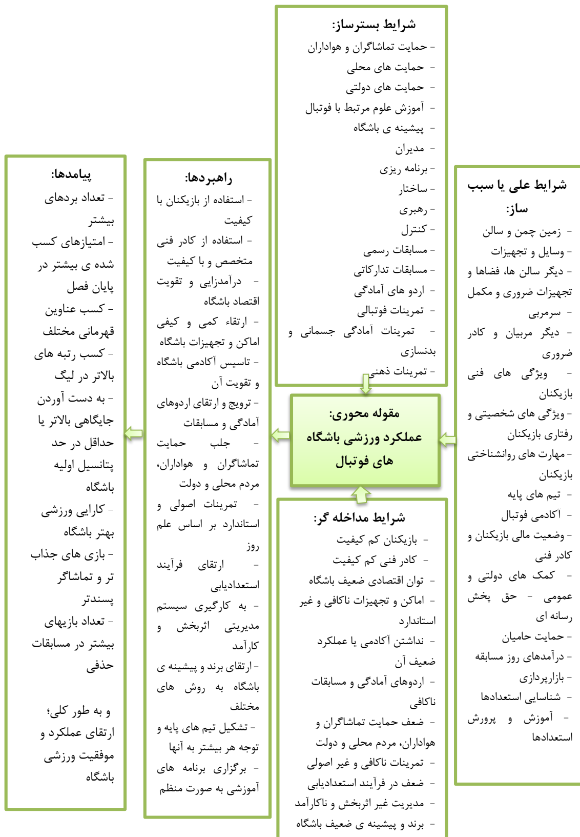
شکل ۱. کدگذاری محوری (الگوی پارادایمی عوامل اثرگذار بر عملکرد و موفقیت ورزشی باشگاه های فوتبال)