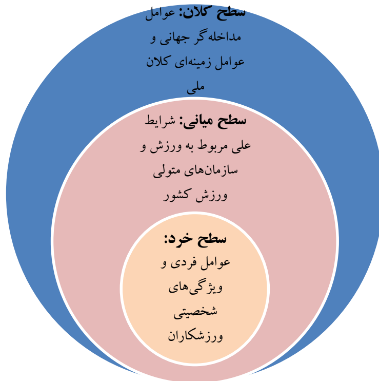
شکل شماره (۲). عوامل مؤثر بر گرایش به مهاجرت ورزشکاران نخبه

ارائه تصویری اجمالی از عوامل مؤثر بر گرایش به مهاجرت ورزشکاران نخبه بود.