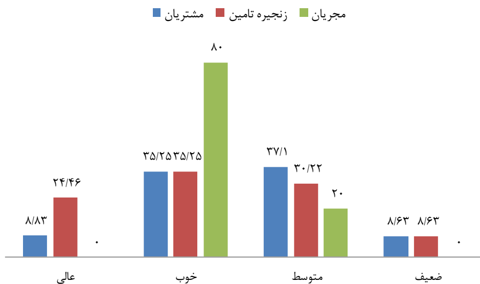
شکل ۲. توزیع فراوانی درصدی نظر نمونه‌های تحقیق در خصوص ارزیابی کارت‌های تخفیف ورزشی