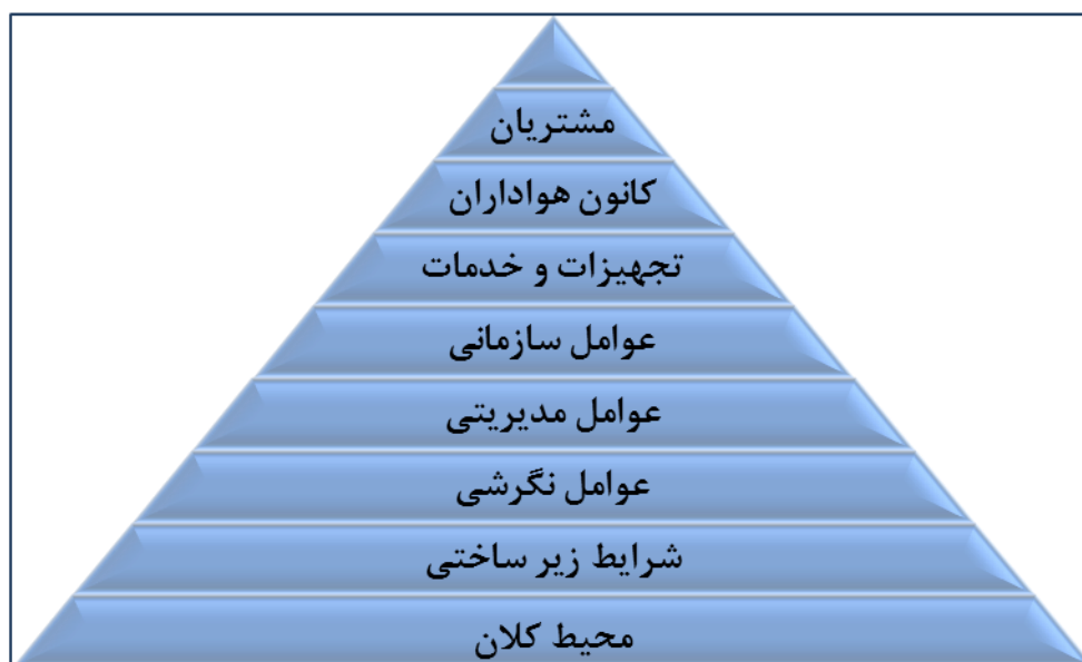
شکل ۲. الگوی نظری عوامل محیطی مؤثر بر مدیریت ارتباط با مشتری در باشگاه‌های حرفه‌ای فوتبال ایران

در صنعت ورزش آشنایی داشتند و هم روش کیفی را می‌شناختند. از این خبرگان خواسته شد تا نظرهای خود در مورد فرایند تدوین و مدل نهایی را ارائه دهند؛ بیشتر آنها مدل را تأیید کردند و بعضی از آنها نظرهای اصلاحی داشتند که در فرایندی رفت‌وبرگشت، اصلاحات اعمال و نظر نهایی آنها دریافت شد.